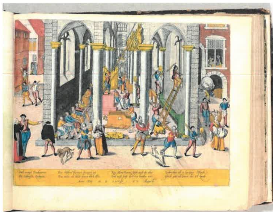
177 gravures montrant des villes et villages des Pays-Bas dans les années 1550 à 1600, pendant les guerres de religion. Estimation 3.000-4.000 €.

1600, des tableaux colorés relatant des événements historiques pendant les guerres de religion à Anvers, Bruxelles, Cambrai, Courtrai, Malines, Valenciennes, Delft, Maastricht, Rotterdam... »