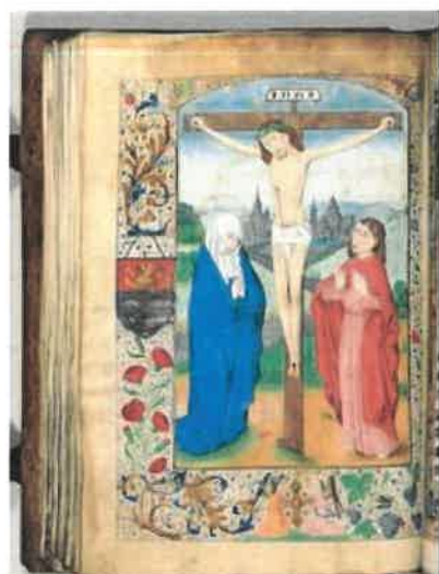
Le missel de sainte Gudule (1487). Estimation 25.000-30.000€.